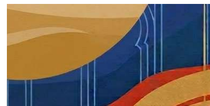
Table ronde 3