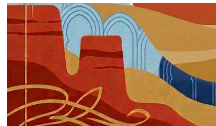
Table ronde 4