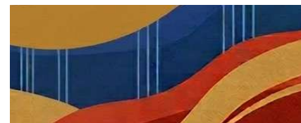
Table ronde 2