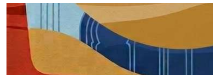
Table ronde 1